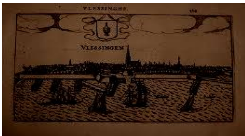
Vlissingen 17e eeuw

Heel duidelijk wijst De Raad op ernstige wijze de christelijke koopman op zijn christenplicht. De koopman heeft met de slaaf naar lichaam én ziel van doen. Dit betekent dat hij overeenkomstig het verbond voor de slaaf als mens, die het beeld van God als zijn/haar Schepper met zich meedraagt, ten volle verantwoordelijk is.